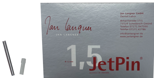
(JetPin1.5mm 1000 本入)